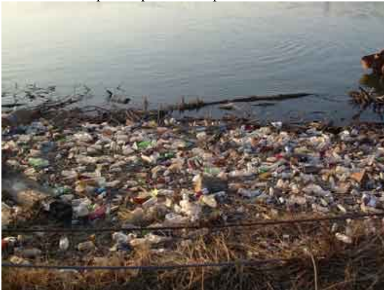
Слика 4.1.1. Непримерено одлагање отпада

приморано да решава проблеме тек када су ескалирали. Пуно времена и новца се губи на сакупљању смећа са “ дивљих сметилишта “, сакупљање отпада расутог поред препуњених судова за смеће, поправкама возила после њиховог преоптерећења и др.