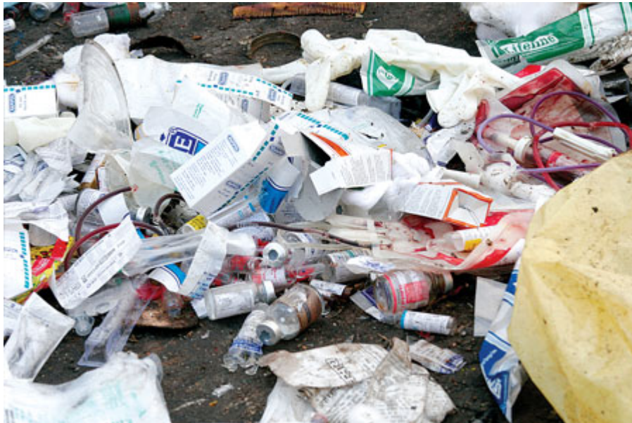
Слика 7.5.1. Неадекватно управљање медицинским отпадом

Као и за већину других врста отпада, у Србији постоји врло ограничен број поузданих података о настајању медицинског отпада, било да се ради о биохазардном медицинском отпаду или о укупном отпаду из здравствених установа. Треба истаћи да углавном нема раздвајања отпада на извору, као и да се медицински отпад депонује уз остали комунални отпад на депонији-сметлишту. Нема посебних мера предострожности или процедура за руковање, транспорт или одлагање отпада из медицинских или сличних објеката.