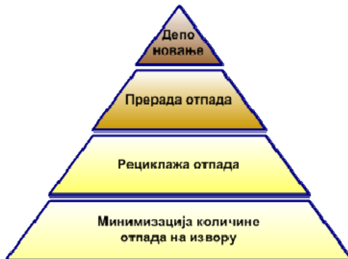
Слика 1.1.1. Циљеви управљања отпадом

Дугорочни циљ израде Локалног плана управљања отпадом је решавање проблема у области заштите животне средине и побољшање квалитета живота становништва осигуравањем жељених услова животне средине и очувањем природе засноване на одрживом управљању животном средином.