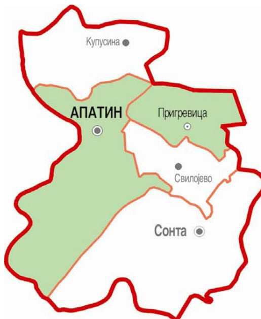
Слика 5.2.1: Територија одношења отпада