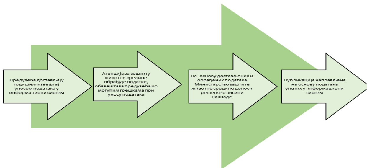
Слика 1. Ток достављања и обраде података

Пресек података за извештајну 2022. годину рађен је у августу 2023. године.